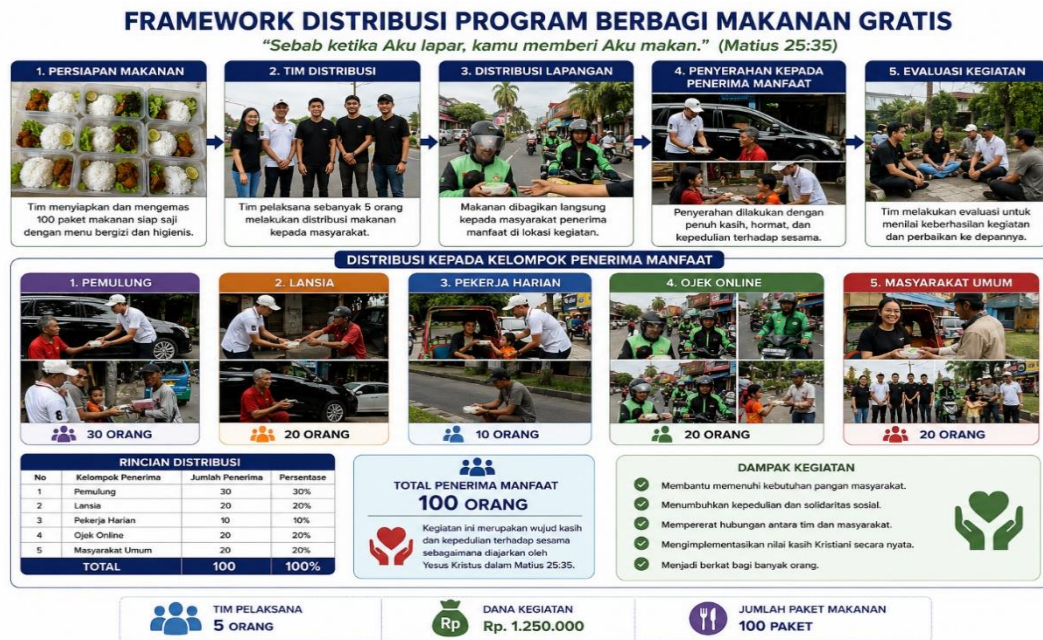
Gambar 2 Alur Distribusi

Framework ini menggambarkan alur pelaksanaan kegiatan pengabdian masyarakat yang diawali dengan pengelolaan sumber daya berupa tim pelaksana sebanyak lima orang, dana kegiatan sebesar Rp1.250.000, dan penyediaan 100 paket makanan siap saji. Selanjutnya dilakukan proses persiapan, pengemasan, dan distribusi makanan kepada lima kelompok penerima manfaat yang terdiri atas pemulung, lansia, pekerja harian, pengemudi ojek online, dan masyarakat umum. Kegiatan ini menghasilkan manfaat langsung bagi 100 penerima serta memberikan dampak sosial berupa meningkatnya kepedulian, solidaritas, dan implementasi nilai kasih Kristiani sebagaimana diajarkan dalam Matius 25:35.