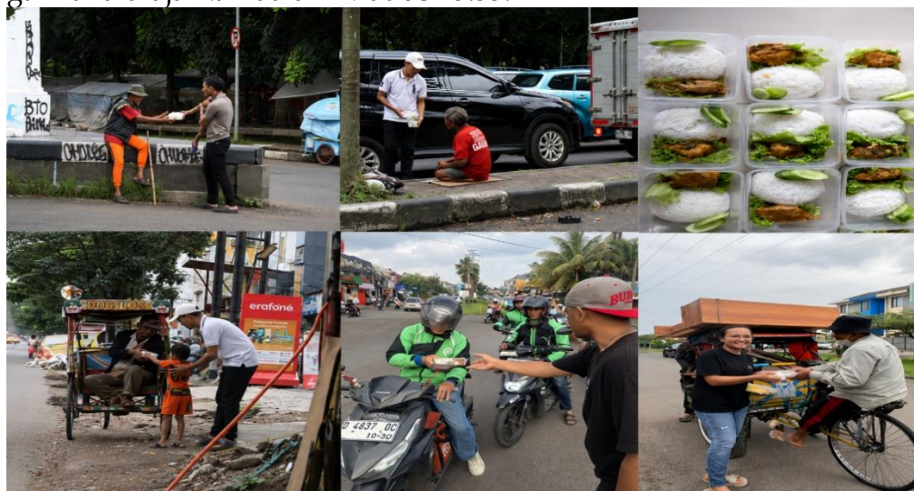
Gambar 3 Pelaksanaan Kegiatan

Framework ini menggambarkan alur pelaksanaan kegiatan pengabdian masyarakat yang diawali dengan pengelolaan sumber daya berupa tim pelaksana sebanyak lima orang, dana kegiatan sebesar Rp1.250.000, dan penyediaan 100 paket makanan siap saji. Selanjutnya dilakukan proses persiapan, pengemasan, dan distribusi makanan kepada lima kelompok penerima manfaat yang terdiri atas pemulung, lansia, pekerja harian, pengemudi ojek online, dan masyarakat umum. Kegiatan ini menghasilkan manfaat langsung bagi 100 penerima serta memberikan dampak sosial berupa meningkatnya kepedulian, solidaritas, dan implementasi nilai kasih Kristiani sebagaimana diajarkan dalam Matius 25:35.